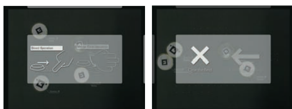
図3 モード切替時に表示される画面（左）と行動のキャンセル時などに表示される画面（右）

FTIR (Frustrated Total Internal Reflection)[3]を利用する。本方式では赤外光がアクリルパネル内で全反射し、接触した面のみ反射率が変わってディスプレイ下の赤外カメラから塊(Blob)として認識できる仕組みとなっている。